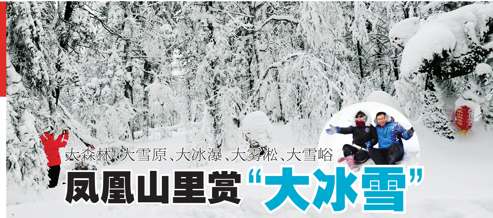
文/摄 本报记者 丁毅

有“冰雪之冠”之称的黑龙江,是冰雪旅游资源的大省。“哈尔滨—亚布力—中国雪乡—凤凰山”这一白金旅游线,已成为冰雪旅游最经典的冬季旅游产品之一。凤凰山更是以其大森林、大冰雪、大冰瀑、大雾凇、大雪原、大雪谷而独具魅力。近年来,原生态、纯自然的凤凰山成为“冰雪之冠”新观点。