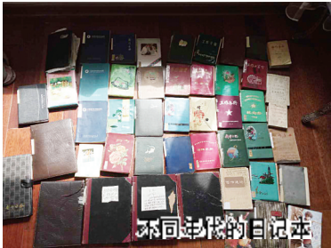
不同年份的日记本