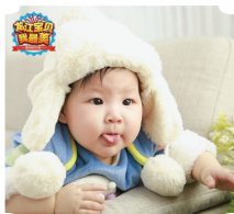
权永隽仪 7个月 票数:2727