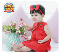
方菲 3周岁 票数:3074