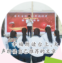
幸福朗读台上，大声朗读自己推荐的文章