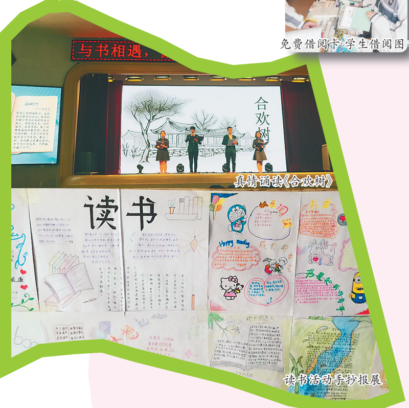
读书活动手抄报展