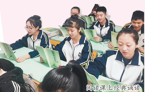
阅读课上经典诵读