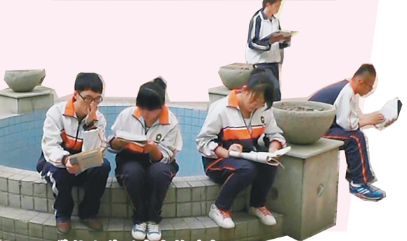
学校小花园中安静读书

哈尔滨市第八中学校以“书式生活，做幸福读者”为主题，在保证一周一节阅读课的前提下，开展系列读书活动。让书籍走进学生的生活，陪伴学生成长，引导广大师生感受阅读的快乐，体验人生的幸福。力争让学生三年中收获良好的阅读习惯，并让这个习惯改变学生的命运，促进学生终生的发展。