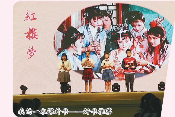
我的一本课外书——好书推荐