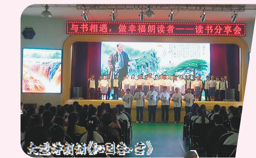
与书相遇，做幸福朗读者——读书分享会