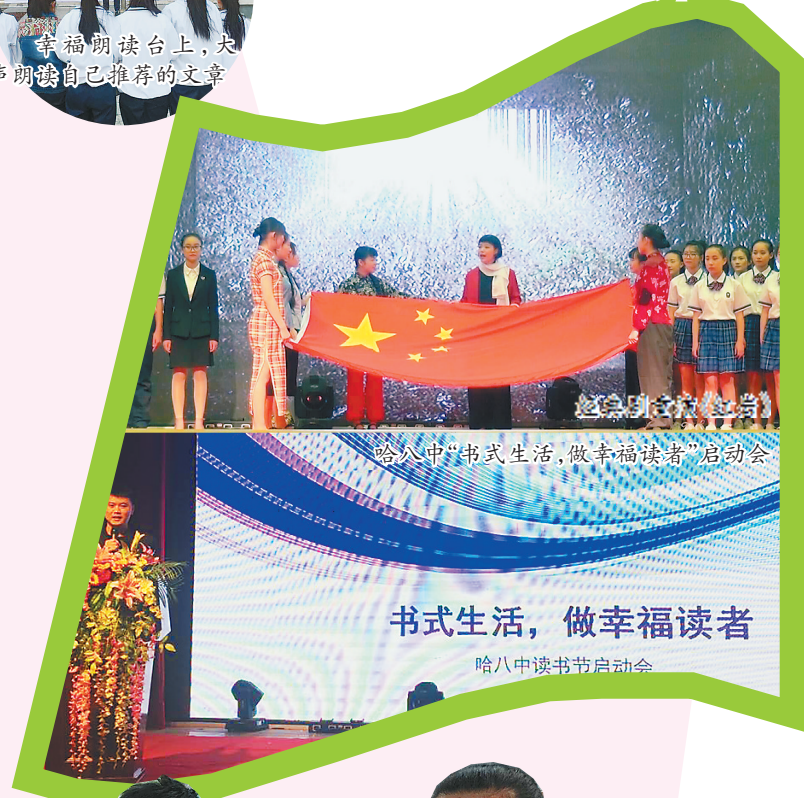
哈八中“书式生活，做幸福读者”启动会