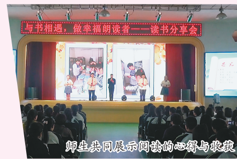
师生共同展示阅读的心得与收获