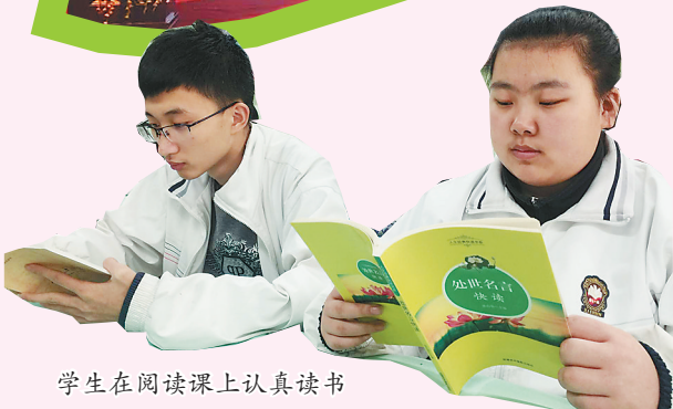
学生在阅读课上认真读书