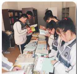
免费借阅卡 学生借阅图书