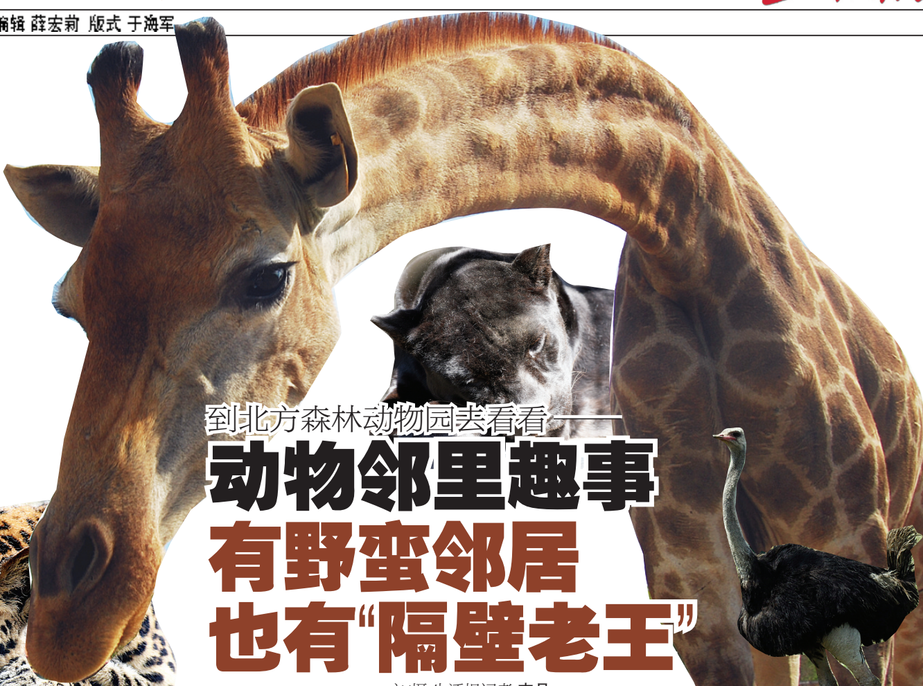
长颈鹿和鸵鸟无视对方