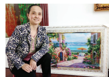
文/摄影 生活报记者 王晓晨

退休生活,有人喜欢跳舞,有人喜欢唱歌,而家住哈尔滨市建国公园附近的陈丽,则把退休时间用在十字绣上。