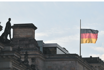
德国柏林议会大厦为科尔降半旗