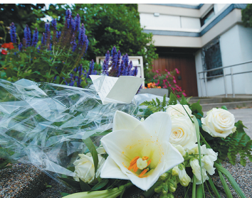
放在科尔住宅前的鲜花

他的突然离世令国际社会震惊。联合国秘书长古特雷斯、欧盟委员会主席容克等人都在第一时间对科尔的去世深表悲痛。从外界对科尔的评价中不难看出,这位德国前总理在世界政坛享有崇高的地位。