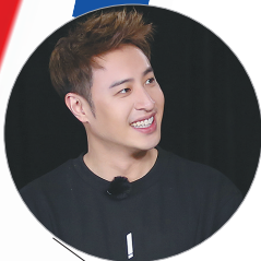
生活报记者 纪秋韵

1日晚,火爆朋友圈的《楚乔传》迎来大结局,口碑两极化,成为观众津津乐道的话题。生活报记者获悉,2017年下半年,包括孙俪主演的《那年花开月正圆》、周迅主演的《如懿传》等热播或正在热播的女性题材剧多达20余部,堪称“大女主戏”的爆发年。对此业内人士直言,“大女主戏”扎堆容易加速观众的审美疲劳,不玩套路的好作品才有机会获得观众认可。”