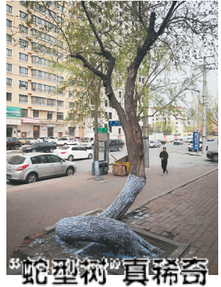
蛇型树真稀奇 在哈市香坊区旭升街路边,有一棵“蛇形树”,它根部出现一个直径约两米的圆圈。一位在附近居住的居民介绍,这棵大树曾被大风刮倒,但是它没有死掉,而活了下来,这才造就了这“奇异”的身姿。