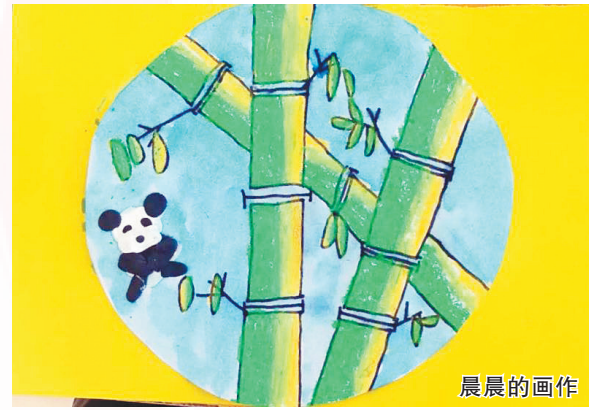
生活报讯(实习生杨嘉钰 王艺霖 记者李丹文/摄)4月29日是“五一”假期第一天,生活报联合阿里天天正能

量发起的“植下一片绿意守望星星的孩子”2018公益春植正式开启植树模式,1000名龙江读者来到神鹿山景区(黑龙江省森工平山管理局皇家鹿苑景区)旁,共同栽种300株云杉树。活动中,阿里巴巴天天正能量为每一株栽种的绿植捐赠20元公益基金,基金将变为美术包,下周起送到冰城自闭症孩子手中。 在许多自闭症孩子看来,“打开”世界的方法有很多,其中绘画,就是最