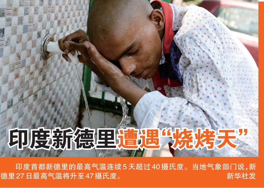
印度首都新德里的最高气温连续5天超过40摄氏度。当地气象部门说,新德里27日最高气温将升至47摄氏度。