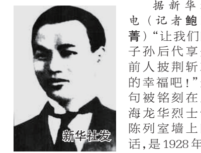
海龙华的陈乔年烈士就义前的慷慨陈词。牺牲时,陈乔年年仅26岁。 陈乔年,安徽怀宁人,陈独秀次子,

生于1902年。1915年入上海法语补习学校学习,两年后进入震旦大学学习。1919年底赴法勤工俭学,1922年发起成立旅欧中国少年共产党,同年转为中国共产党党员,是中共旅欧支部领导成员之一。