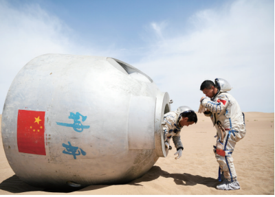
据新华社电(薛艳雯 李国利 朱霄雄)15名中国航天员日前在巴丹吉林沙漠圆满完成了野外生存训练。这是我国首次在着陆场区沙漠地域组织的航天员