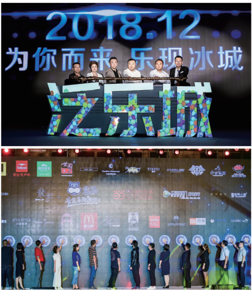
王府井·泛乐城一项目启动仪式及签约仪式