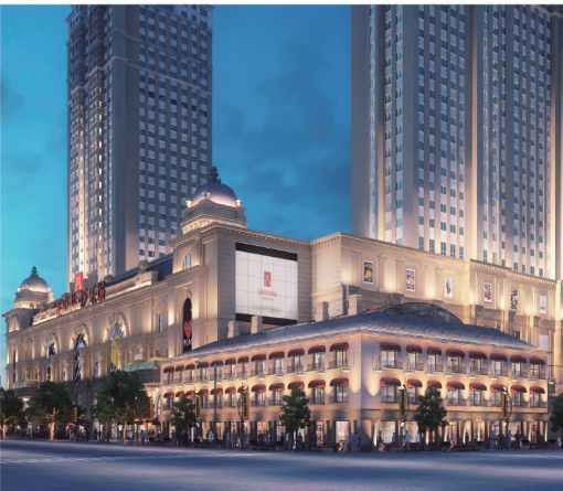
王府井·泛乐城一夜景效果图

王府井·泛乐城的绽放定会助推道里老商圈的优化升级，创新的业态布局与四维运营体系将为这一商圈注入激情而又鲜活的生命力。