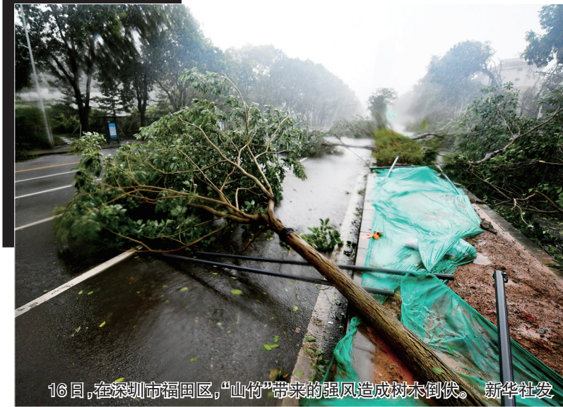
16日,在深圳市福田区,“山竹”带来的强风造成树木倒伏。

这笔未支付的订单却出现在山东。对于弹出的这笔订单，王女士只能选择支付，连“查看明细”都看不了，显示“您没有权限查看”，且这笔订单所属手机号也被遮掩住了。王女士随后报了警，警察致电滴滴方面了解情况，滴滴方面并未向警方透露任何关于该笔订单所属乘客账户及司机信息，只说这笔订单来自王女士的“关联账户”。 记者还联系到多位账户上有未支付订单的滴滴乘客，这些用户往往本人所在地与未支付订单所在区域相差甚远。在记者加入的“滴滴未支付订单投诉群”中，有超过60人遇到了同样的问题。