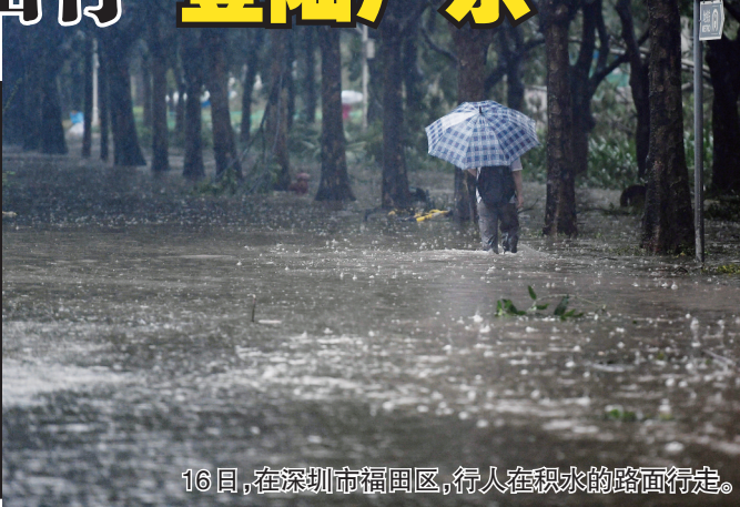
16日,在深圳市福田区,行人在积水的路面行走。

据央视新闻报道 今年第22号台风“山竹”(强台风级)已于16日17时在广东台山海宴镇登陆，登陆时中心附近最大风力14级(45米/秒，相当于162公里/小时)，中心最低气压955百帕。