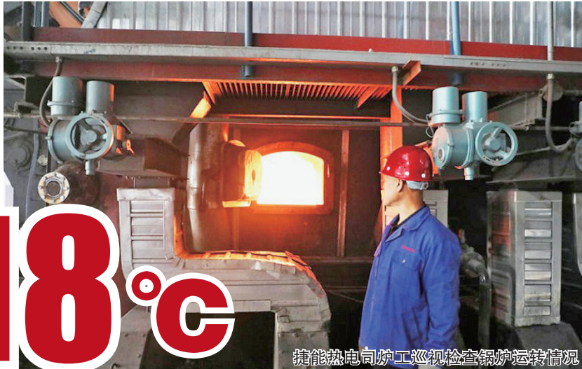
技能热电向炉工巡视检查锅炉运转情况

生活报讯(记者仲亮文/摄)20日,哈尔滨市2018年至2019年供热工作正式开始,按照省、市相关要求,“开栓日室温即达标之时”,即今起保证室温不低于18℃。根据近一段时间市民通过生活报供热直通车专栏咨询的问题,记者进行了梳理并归纳,并由哈尔滨市供热主管部门及大型热企的权威人士进行解答。即日起,如果您还有关于供热方面的问题需要咨询,请拨打生活报供热直通车记者热线13836187639(微信同号),或将问题发送到生活报官方微博或微信公众平台,相关人士将在第一时间为您解答。