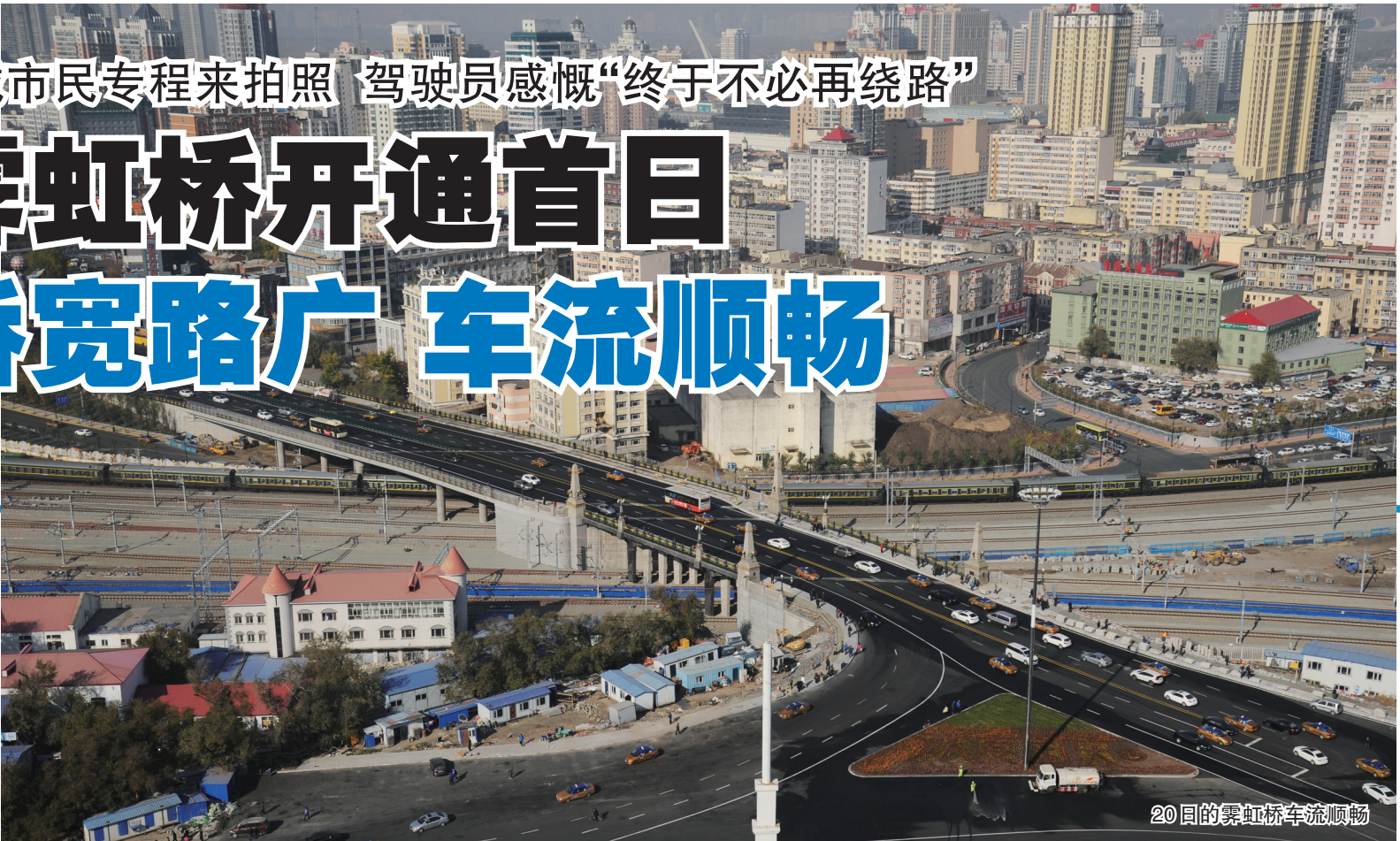
20日的霁虹桥车流顺畅

生活报20日讯(实习生王庆 记者 栾德谦 记者 李巍 摄)今天是霁虹桥恢复通车首日,多条公交线路恢复该路段通行,很多出租车驾驶员、私家车主又重新体验到了行驶在霁虹桥上的便捷。与此同时,霁虹桥通车也引来很多冰城市民及媒体的关注,大家纷纷前来见证这一重要时刻。