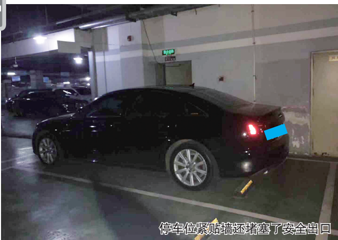
停车位紧贴墙还堵住了安全出口