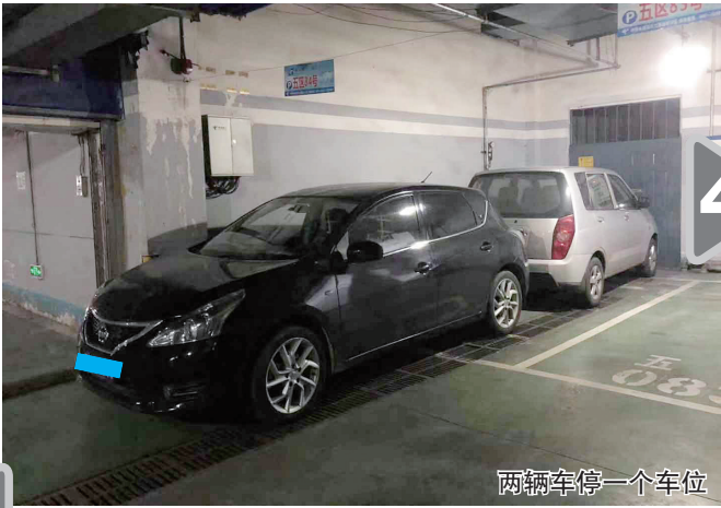
两辆车停一个车位