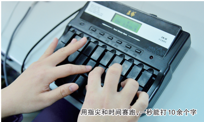
用指尖和时间赛跑，一秒能打10余个字

速录师，被称为用指尖与时间赛跑的人，他们的极限速度是怎样做到的？这个职业的前景怎样，又面临哪些职业挑战呢？生活报记者对此一一进行了采访。