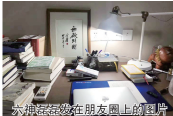
六神磊磊发在朋友圈上的图片