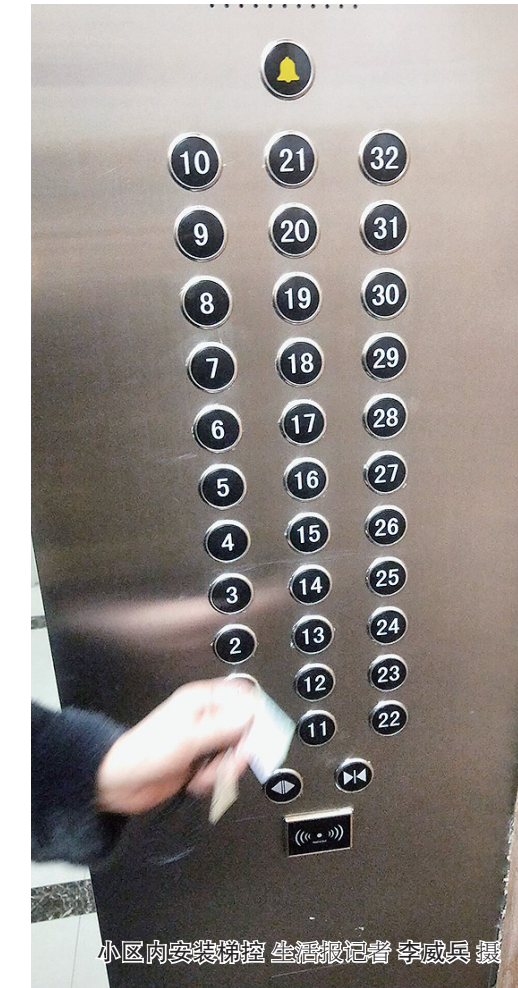
小区内安装梯控

据了解,该局严厉打击证照不齐、超期限经营、超范围经营等违法违规经营行为。严查加工制售假冒伪劣、来源不明食品,一非两超、卫生条件不合格等违法违规行为。严厉打击不明码标价、虚构原材料来源,以养殖冒充“野生”等虚假宣传信息,误导、欺诈骗游客消费的违法违规行为。在旅游景区周边及全区范围内,重点检查如铁锅炖等针对外地游客的涉旅餐饮服务单位。严查生产销售的散装白酒标签标注是否规范,餐饮服务单位助燃剂的使用和存放等问题。