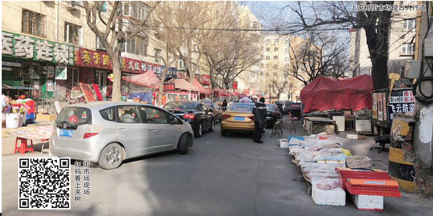
上夹树街市场侵占大行道