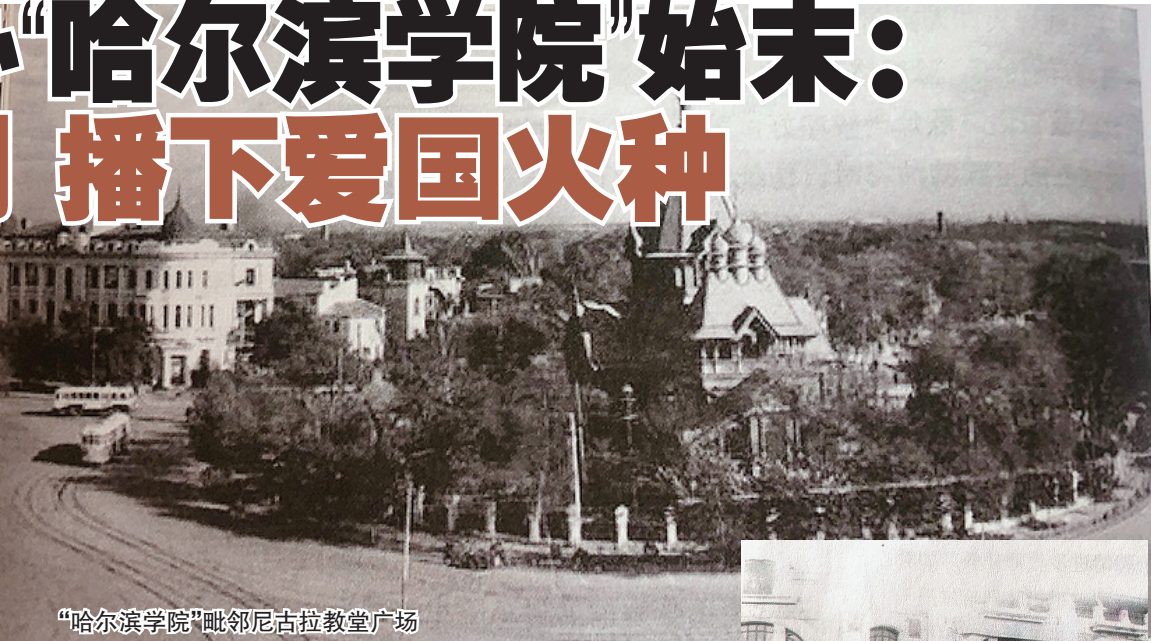
“哈尔滨学院”毗邻尼古拉教堂广场