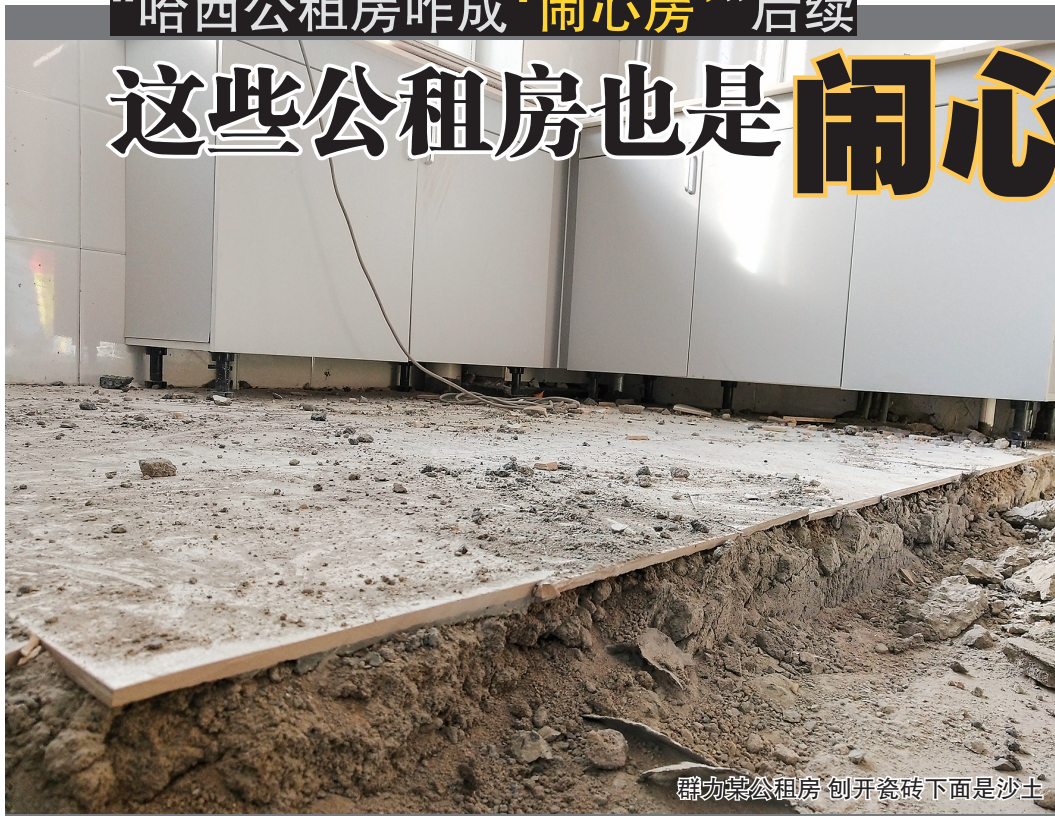
群力某公租房“刨开瓷砖下面是沙土