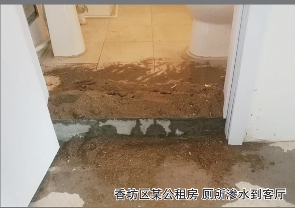
香坊区某公租房 厕所渗水到客厅