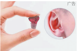
补贴仅限100个名额 先到先得 新款隐形助听器佩戴更美观

为提高耳聋患者的生活质量，帮助耳聋老人摆脱困扰，本报大型“爱要让你听见·耳聋救助行动”启动——为看电视、打电话、听音乐、远距离谈话、聊天听不清等问题提供听力指导，活动现场专业仪器免费检测听力。 报名对象：凡50岁以上的哈尔滨市中老年听力下降、耳聋等听障人群，经审核合格后，可享受助听器补贴。残疾人、教师、军烈属优先申购！报名信息请携带本页报纸。