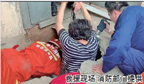
救援现场

13时18分，哈尔滨消防救援支队道里中队出动2台消防车、8名指战员5分钟后赶到现场。该坑并不深，但由