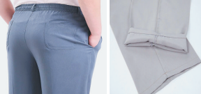
松紧腰、有带扣、西裤剪裁、有型裤脚 轻冰丝、自重免烫、亲肤不沾