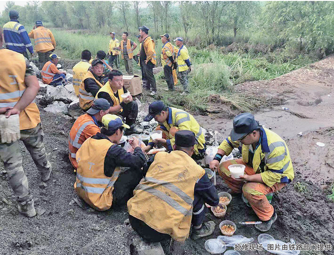
抢险现场