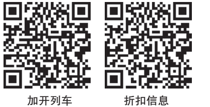
加开列车 折扣信息

“十一”黄金周,哈尔滨局集团公司预计运送旅客429万人次,同比增加26.5万人次。省外客流主要集中在北京、鲅鱼圈、通辽方向,管内客流主要集中在齐齐哈尔、漠河、七台河、海拉尔等方向,哈尔滨局集团公司加开3对哈尔滨西至北京南高铁动车组列车,哈尔滨至北京的旅客列车增加至23对;加开哈尔滨西至鲅鱼圈、通辽方向高铁动车组列车各1对;加开满洲里、漠河、齐齐哈尔、佳木斯、七台河、扎兰屯等方向17.5对旅客列车,并对齐齐哈尔至丹东、