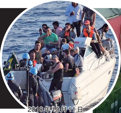
2018年10月11日，地中海海域的非法移民船

最新的进展是，来自英国北爱尔兰的 25 岁货车司机 28 日出庭受审，他被控 39 项过失杀人罪以及共谋贩运人口、协助非法移民偷渡和洗钱等罪行。