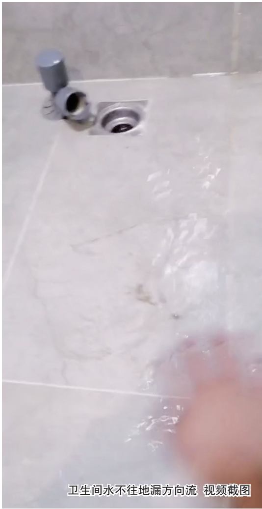
卫生间水不往地漏方向流 视频截图