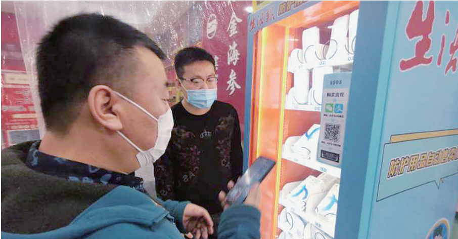
家得乐超市金鼎店 地址:道里区群力第五大道518号 金鼎购物广场二楼 家得乐超市翡翠城店 地址:道里区工农大街100号