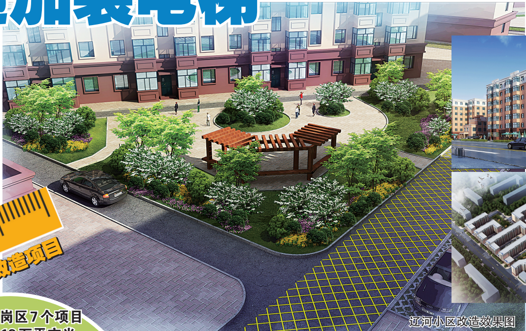
近河小区改造效果图