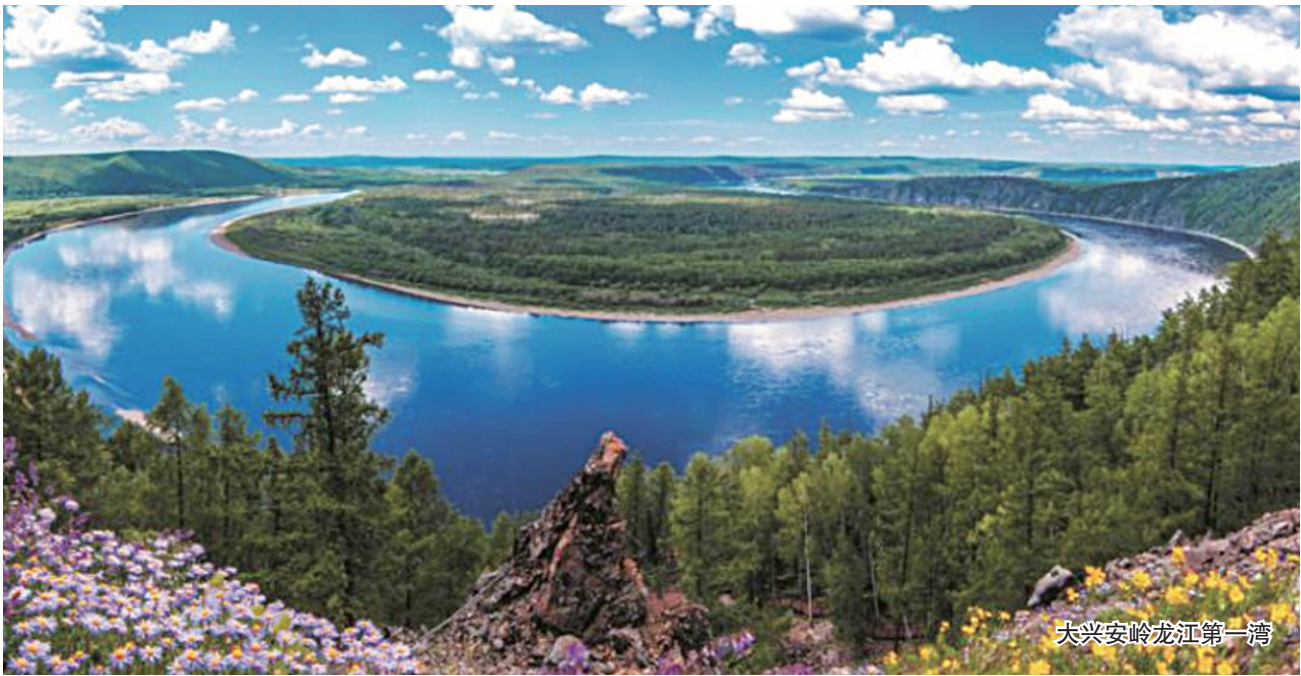
大兴安岭龙江第一湾

其中,黑龙江多家景区的免费门票可通过携程旅行网或携程旅行App首页,点击进入“门票玩乐”版块,点击最上方的滚动广告“黑龙江旅游惠民暑期大促”进入领取页面。旅游消费券总价值200万元,分为门票消费券和酒店消费补贴两