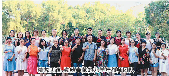
精诚团结、勤勉奉献的九年级教师团队