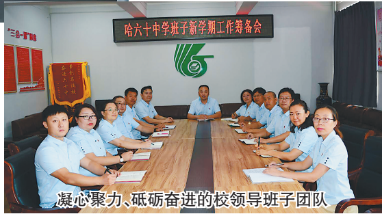
凝心聚力、砥砺奋进的校领导班子团队

尤其在疫情期间，在赵校长的带领下，学校精心部署，守土尽责，全体教师携手并肩，戮力同心，一大批爱岗敬业，勇于担当，默默奉献的优秀教师利用“云端e线”，一直陪伴着同学们共同成长，时刻为学生在知识的海洋里保驾护航。他们春风化雨，滋润着学生渴望知识的心田；他们满腔热忱，书写着对职业的坚定信念；他们至诚执着，诠释了“师者匠心”的内涵真谛！