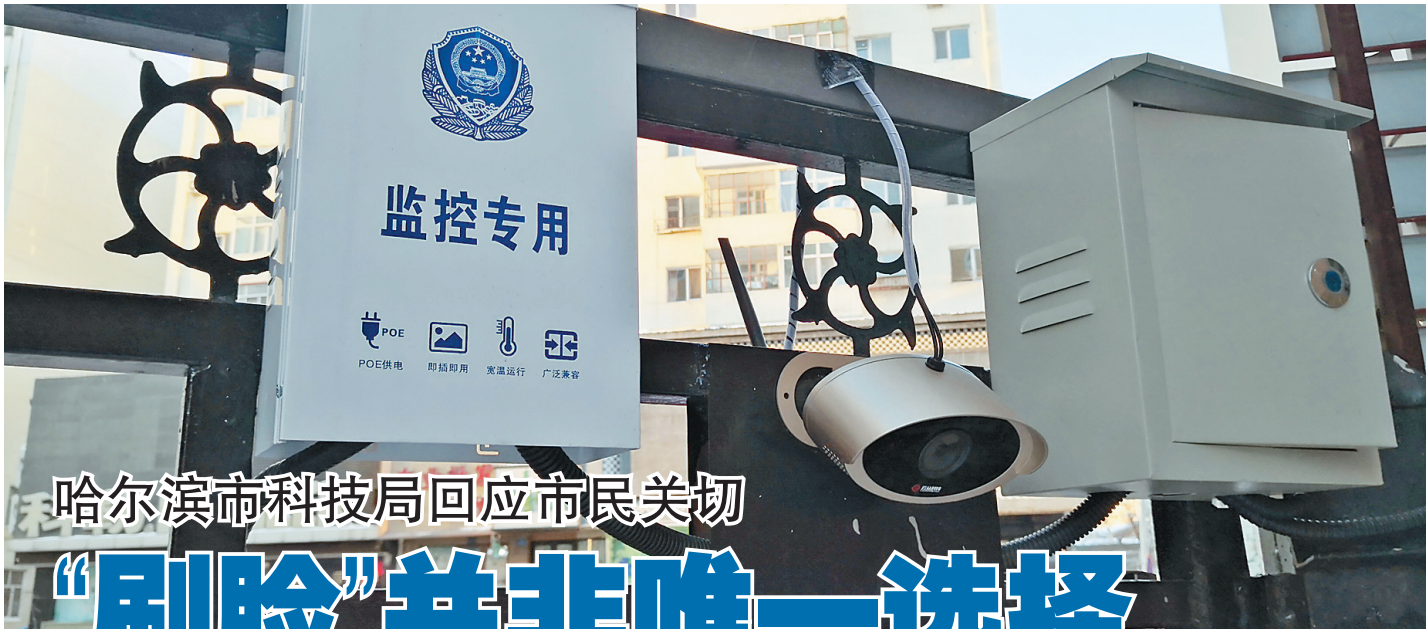
哈尔滨市科技局回应市民关切

“刷脸系统并非居民唯一选择,它是建立在卡扣、对讲呼叫基础上的带有技防安保功能的设施。各区在建设和推广过程中,有自己的进度,但总体上来说,目前这个系统并未联网使用。我们会就出现的问题和市民担心进行公告说明,让大家更放心、更舒心、更贴心地使用它。”3日,“刷脸项目”试点建设牵头单位,哈尔滨市科技局相关负责人就市民关注的问题作出说明。