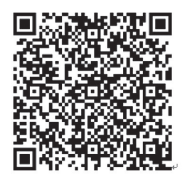
“希望工程守护计划”捐赠二维码