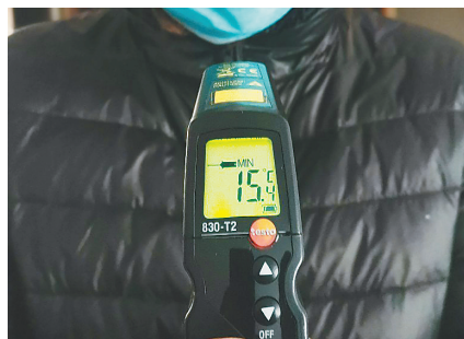
随后,记者用专业测温仪器对景女士家进行了实时测温,结果为15.4℃。

8日10时,记者来到昂昂溪区宏顺小区一期4号楼4单元101室景女士家,一进屋明显感觉到一丝凉意。景女士穿着羽绒服,卧室的被子没叠,“冷了可以随时钻进被窝取暖。”景女士说,她是宏顺小区的老住户,以前供热一直不错,自从三年前开始,供热一年不如一年,尤其今年,室温从来没有超过18℃,白天有阳光屋里还算暖和,到了晚上就像冰窖一样。她曾把情况反映给供热单位,供热单位工作人员入户检查时说“地板太厚,导致地热散热效果差”。第二次反映情况,工作人员称“锅炉坏了”。