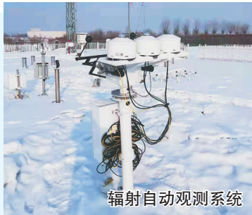
辐射自动观测系统

通过观感纸被太阳晒过的痕迹,测量每天的日照长短。王站长告诉记者,预计今年,这个光电式数字日照计也会经历一次系统升级。