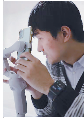
在家中调试直播设备