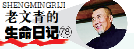
SHENGMINGRIJI 老文青的 生命日记78

哪怕一棵无人知道的小草，也不该在无声无息中死去，甚至我们都不清楚，那无声滑落的，是露水，还是泪水，亦或是自己给自己的，一点儿可怜的流量。我们可能都已经忘了，他们，也是后浪。