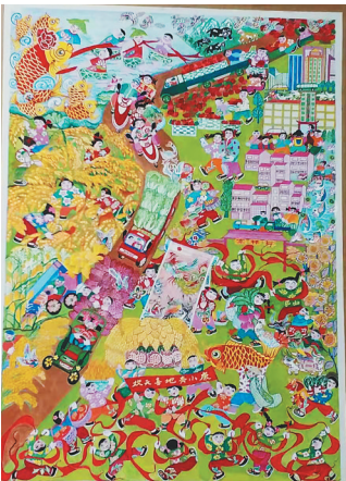
《欢天喜地奔小康》 作者：王淑贤 绥化 70岁