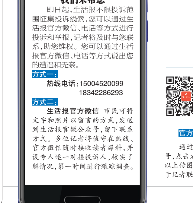
消费维权难 我们来帮您

记者向负责该地区的先锋路市场监督管理所了解情况，市场监督管理所工作人员说：“现在没法说他家是黄了还是跑了，因为房子还在，只是没营业，但是负责人失联。”工作人员介绍，2019年11月，该企业负责人表示要对室内进行重新装修，于是开始停业，2019年12月时还能联系到负责人。到了2020年七八月份时，陆续有数十位消费者通过各种方式向市场部门反映该企业没营业，担心卡内存的钱无法兑现，想要退款。这时，市场监管部门再联系该企业负责人，发现负责人已经失联。工作人员又找到该企业的会计，但会计也无法联系到负责人，也不知道该不该开业。“听说他家的房子是老板自己的，因为他家房子一直空着，也没有其他经营者用作其他用途，所以，你说他不干、跑了，这些事谁都没法认定。”工作人员表示，目前该企业由于负责人失联，已经被列入异常名录。