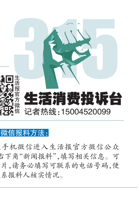
官方微信爆料方法：

通过手机微信进入生活报官方微信公众号，点击右下角“新闻爆料”，填写相关信息。可以上传图片，请务必填写可联系电话号码，便于记者联系爆料人核实情况。