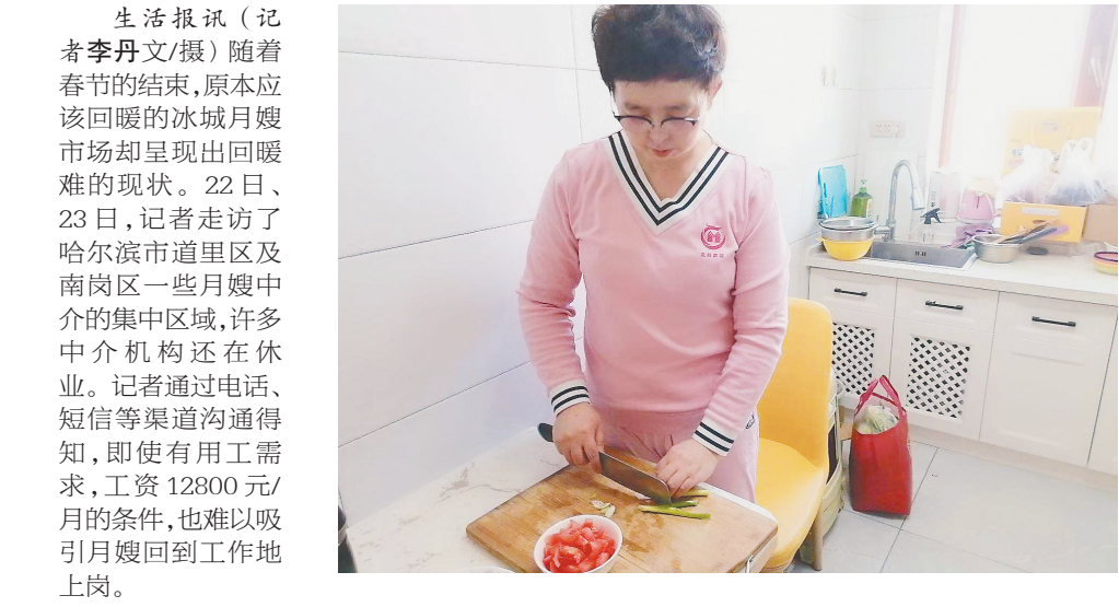
生活报讯随着春节的结束，原本应该回暖的冰城月嫂市场却呈现出回暖难现状。22日、23日，记者走访了哈尔滨市道里区及南岗区一些月嫂中介的集中区域，许多中介机构还在休业。记者通过电话、短信等渠道沟通得知，即使有用工需求，工资12800元/月的条件，也难以吸引月嫂回到工作地上岗。

记者在木兰街走访中了解到，以往春节过后，月嫂用工价格可能会有些波动，除了常规的同行业竞争因素外，最主要的原因是价格相对较低的月子中心吸引了准妈妈们。月子中心原本四万元左右的服务套餐，优惠力度较大时，两万以内就可搞定。但是不同于以往，由于一些特殊原因的影响，今年春节过后，月嫂需求数量增加，工资保持在12800元/月，有的甚至达到了15800元/月。“订单每天至少