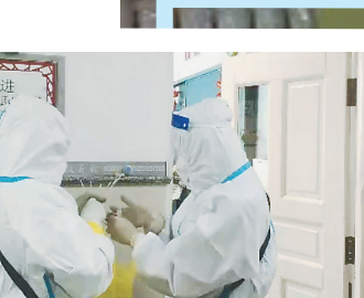
生活报讯（记者吕晓艳）21日，哈尔滨市教育局发布通知，明确了2021年全市中小学校春季学期开学时间。3月3日哈尔滨市高中（中职）毕业年级；3月11日起全市高中（中职）非毕业年级、初中、小学、幼儿园各区县（市）教育部门联合卫健、市场等相关门

核验收合格后，将有序开学、开园。23日，记者对哈尔滨市中小学新学期开学前的相关准备工作进行了采访。