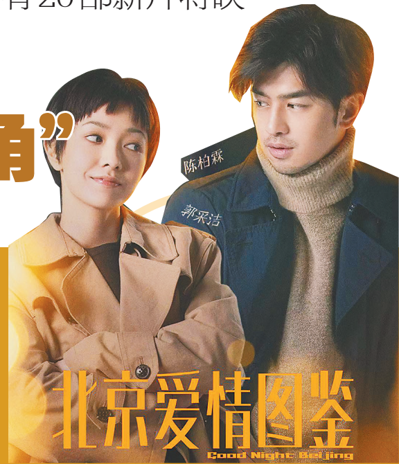
生活报记者 王雪莹

自冰城影院恢复营业后,观众们看电影的热情一直持续。进入3月,除了《你好,李焕英》《唐人街探案3》《刺杀小说家》《人潮汹涌》《侍神令》等“老片”外,还有20余部新片将要亮相。记者从金安国际影城、中影中教国际影城获悉,虽然这些新片鲜少有称得上“爆款”的作品,但好在类型多样,包括爱情、传记、悬疑、战争、奇幻、动画等,尤其喜剧题材依旧是本月重头戏。