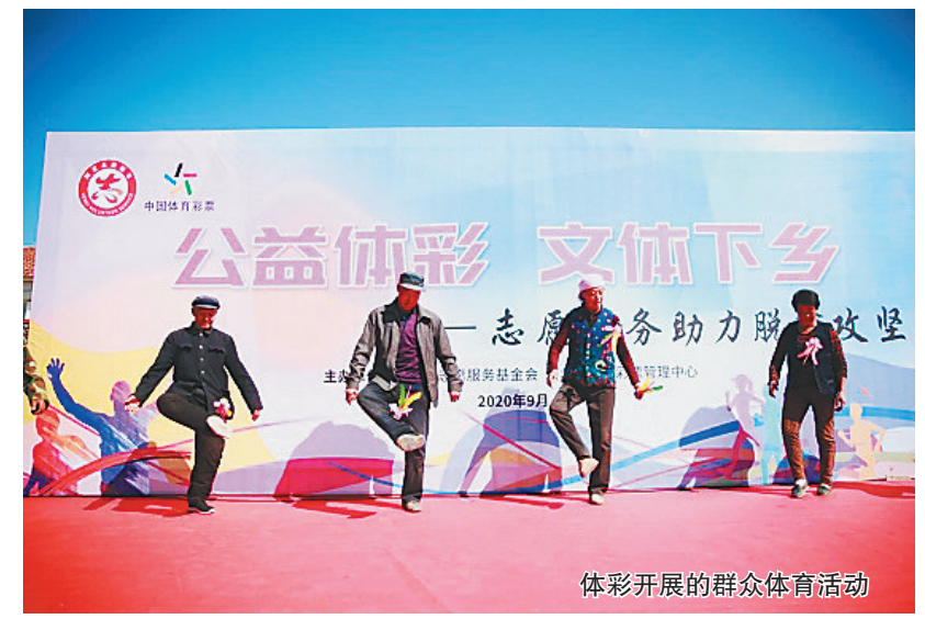
体彩开展的群众体育活动

教育助学方面,“励耕计划”、“滋蕙计划”和“润雨计划”是经国务院批准,财政部、教育部委托中国教育基金会由中央财政从中央专项彩票公益金中安排专项资金开展教育助学的项目。2014至2019年间,三项计划共资助多达200万余人,投入资金超过99亿元,为家庭经济困难的学生和教师送去关爱。2012年至今,全国各级体彩机构投入5542万元,在全国范围内