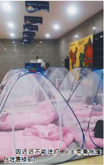
因迟迟不能进户，业主带着帐篷住进售楼部。