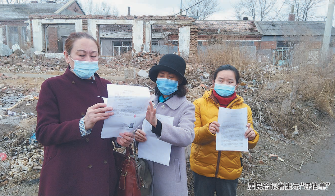
居民给记者出示“评估单”