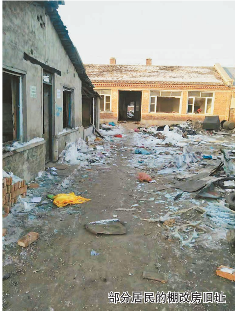
部分居民的棚改房旧址