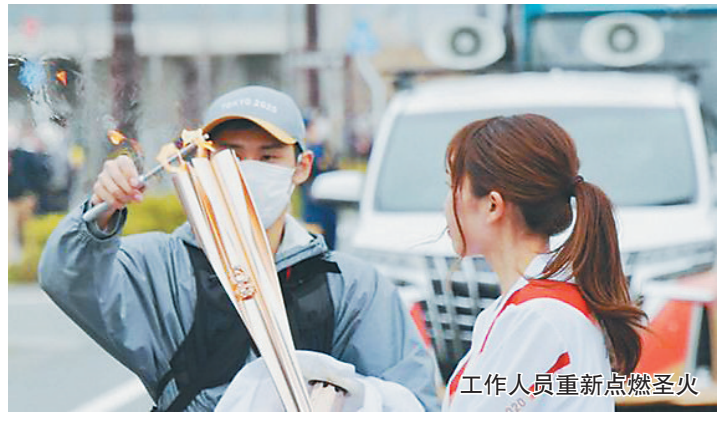
工作人员重新点燃圣火

就在奥运圣火开启传递之际,虽然东京都及其周边3个县于本月22日解除了紧急状态,但日本单日新增新冠确诊病例数呈增加之势;多个项目的奥运资格赛仍未尘埃落定,组织者、参赛者都在与时间赛跑;东京奥运会最终版防疫手册要到6月才会公布,这份初版便已多达32页的奥运行动指南,还需要时间进行更多完善与细化。