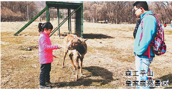
森工平山皇家鹿苑景区