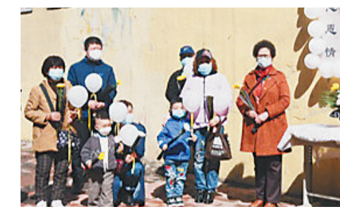
放飞白气球祭故人

清明期间,在牡丹江文化广场则举行了一场别样清明祭扫活动,与以往不同,今年该市殡葬服务中心与邮政部门合作,专门印制了文明祭祀追思卡,卡片精美、内涵丰富。市民可以通过邮寄追思卡的方