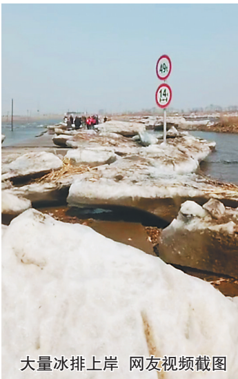
大量冰排上岸 网友视频截图