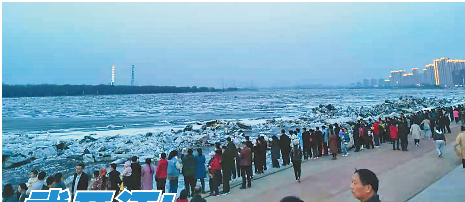
开江引来市民围观