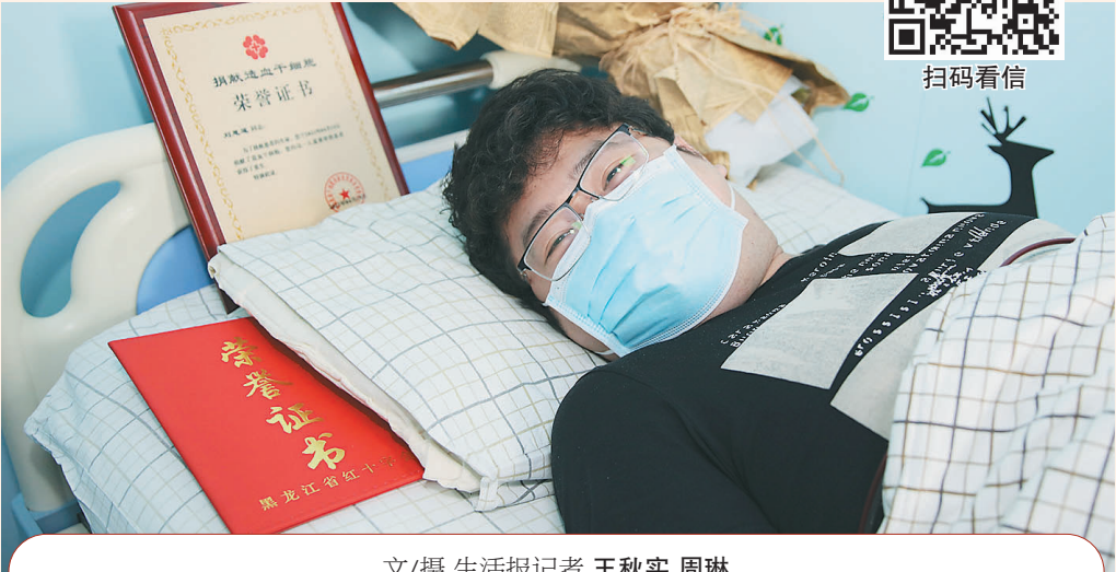
文/摄 生活报记者 王秋实 周琳