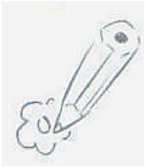
看图片猜成语，答案本版找