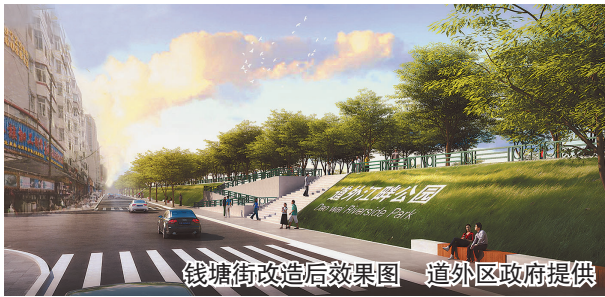
钱塘街改造后效果图

批，养大就送人了。”薛女士说，最近，她家孩子又喜欢上了五年级课本里描述的珍珠鸟，很多小朋友都从作家冯骥才老先生笔下得知了这种鸟，特别可爱。“我家现在同时养着鸟和植物，还有几条鱼……家里的‘鸟语花香’，给孩子和全家人带来了特别多的快乐。让孩子饲养和爱护小动物，有助于培养孩子的责任心。花鸟鱼市场对我们家来说，是一个一想到就充满期待的所在。”