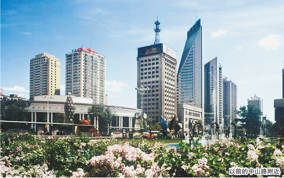
以前的中山路附近

从2005年开始，哈尔滨市启动了兆麟街区改造项目，此后又多次改造。如今，车流、人流拥堵，街心的丁香也大量减少，只剩下一段路有丁香，石头道街至田地街路段改造时，连绿地都没留，更别提栽丁香了。